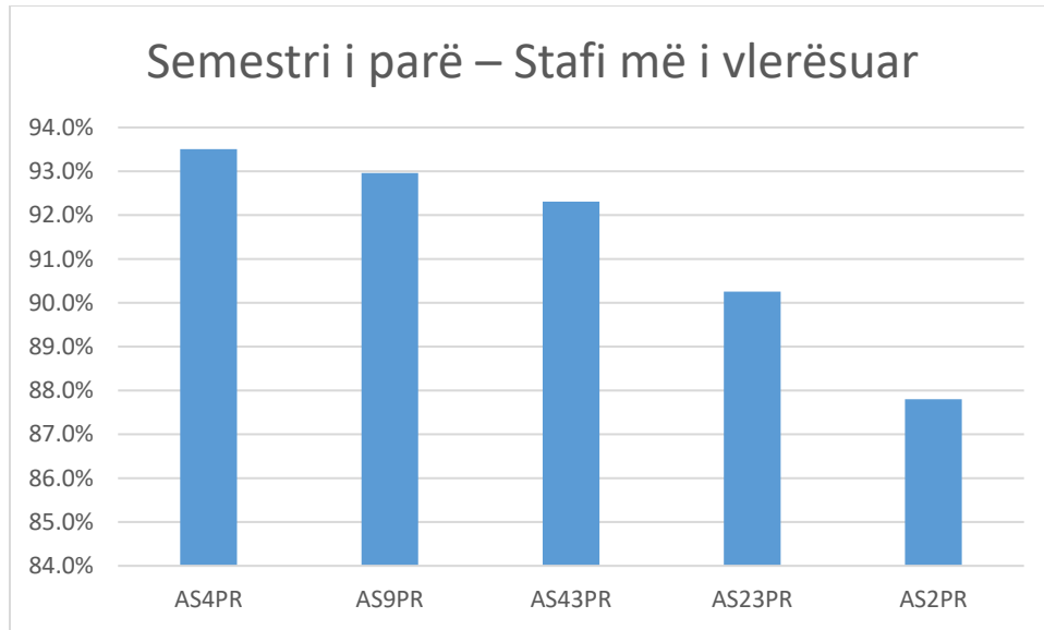
Figure 2 Semestri i parë – Stafi më i vlerësuar

Në semestrin e parë, pesë nga stafi akademik me vlerësimin më të lartë paraqiten në figurën 2, ku stafi AS4PR vlerësohet me 93,5% në raport me kënaqësinë e studentëve për stafin akademik, ndërsa stafi me vlerësimin më të ulët është stafi akademik AS47PR me vlerësimin 65% siç paraqitet në tabelën 1.