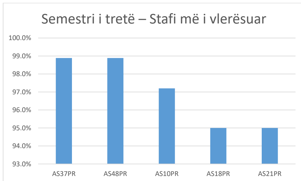
Figure 3 Semestri i tretë – Stafi më i vlerësuar

Në semestrin e parë, pesë nga stafi akademik me vlerësimin më të lartë paraqiten në figurën 2, ku stafi AS4PR vlerësohet me 93,5% në raport me kënaqësinë e studentëve për stafin akademik, ndërsa stafi me vlerësimin më të ulët është stafi akademik AS47PR me vlerësimin 65% siç paraqitet në tabelën 1.