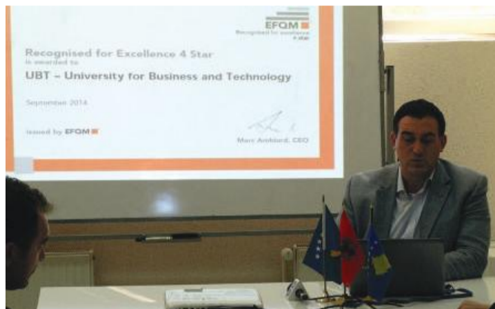
“UBT me të drejtë tani po konsiderohet si ambasador i dijes dhe shkencës në Republikën e Kosovë”

“UBT-ja nuk po mendon vetëm për veten, por ne po punojmë që përfutur të drejtpërdrejtë të jetë edhe Kosova. UBT-ja ka pasur rezultate, hulumtime, publikime, dhe ka një infrastrukturë moderne, laborator modern dhe të gjitha këto kanë ndikuar që të marrim vlerësime nga të gjitha fushat si për cilësi, menaxhim, leadership etj.