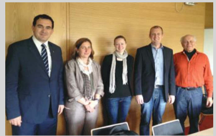
Tema kryesore e bisedave ishte transferi i dijes nga universiteti në shoqëri

Universiteti RWTH Aachen është pjesë e “Iniciativës për ekselencë” dhe renditet si një ndër universitetet më të mira në Republikën Federale të Gjermanisë.