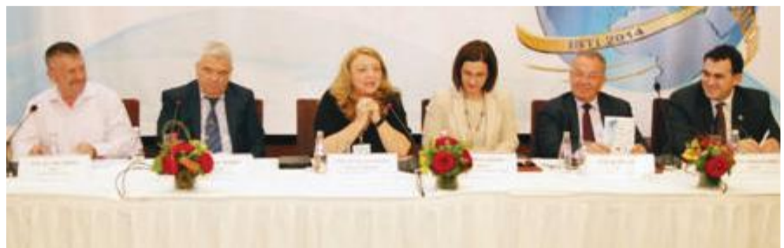
Konferenca dyditore shkencore në nivel ndërkombëtar me temën "Sistemet e Informacionit dhe Teknologjitë inovative drejt një ekonomie digjitale"

12 qershor 2014- Departamenti Matematikë, Statistikë dhe Informatikë në kuadër të Fakultetit të Ekonomisë në Universitetin e Tiranës (UT), për herë të pestë organizoi konferencën dyditore shkencore në nivel ndërkombëtar me temën "Sistemet e Informacionit dhe Teknologjitë inovative drejt një ekonomie digjitale". Konferenca u organizua nën patronazhin e Akademisë të Shkencave të Shqipërisë, dhe me bashkorganizim të UBT-së, dhe u mbajt në kryeqendrën e Republikës së Shqipërisë, Tiranë.