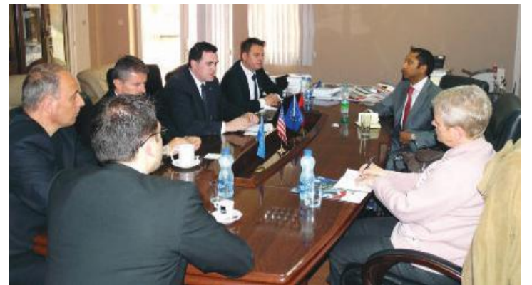
Si pjesë e partneritetit afatgjatë, Ambasada e SHBA-së dhe UBT u përkushtuan të punojnë në gjetjen e mënyrave për avancimin e zhvillimit profesional, përmirësimin të ambientit biznesor dhe mbështetjen institucionale për vetëpunësim dhe ide kreative biznesore të studentëve

Si pjesë e partneritetit afatgjatë, Ambasada e SHBA-së dhe UBT u përkushtuan të punojnë në gjetjen e mënyrave për avancimin e zhvillimit profesional, përmirësimin të ambientit biznesor dhe mbështetjen institucionale për vetëpunësim dhe ide kreative biznesore të studentëve.