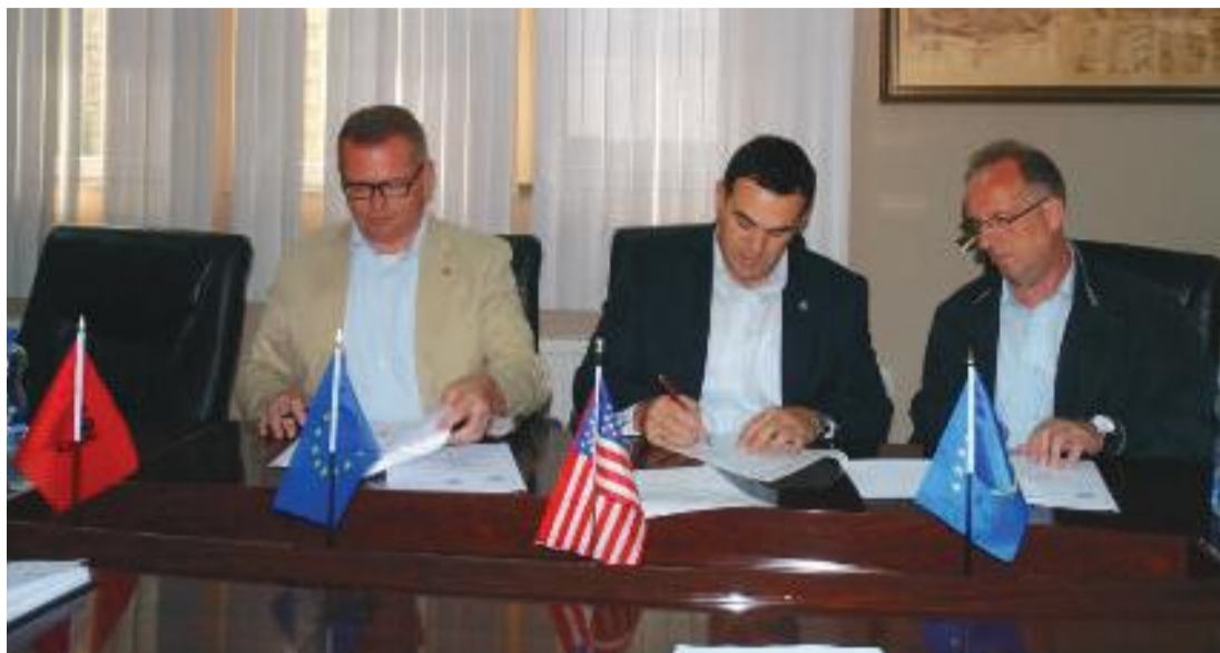
Me këtë momerandum ne shprehim gatishmërinë për bashkëpunim dhe njohje të ndërsjellët, duke synuar implementimin e standardeve evropiane në fushën e gjeodezisë, ngritjen dhe zhvillimin e mëtejshëm të njohurive profesionale të gjeodetëve dhe duke synuar ndërlidhjen e mësimin akademik me punë praktike të gjeodetëve dhe anasjelltas

Po ashtu, ofrimi i shërbimeve profesionale, edukimit dhe trajnimit për gjeodetët anëtarë të Shoqatës duke i shfrytëzuar resurset humane dhe teknologjitet që i posedon UBT.