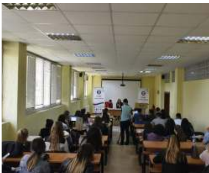
Kosova ka mungesë të noterëve

Themelimi i noterisë në Kosovë, u ka ndihmuar qytetarëve të Kosovës për zgjidhjen e problemeve që kanë të bëjnë me çështjet ligjore, ndërkaq në të njëjtën kohë është lehtësuar puna e gjykatave në vend.